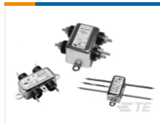
TE 产品编号1-6609021-4 CORCOM B 系列单相滤波器