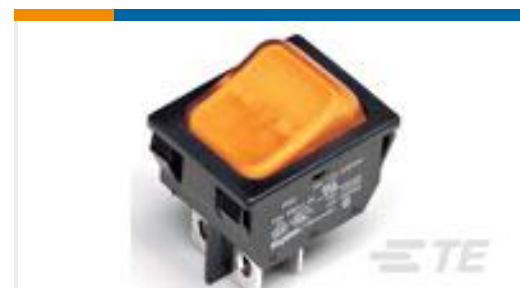
TE 产品编号1634201-2 PRFDA1-16F-BB0BW