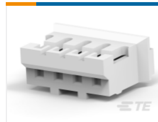
TE 产品编号1-1470107-2 AMP HPI 2.0MM 母端外壳