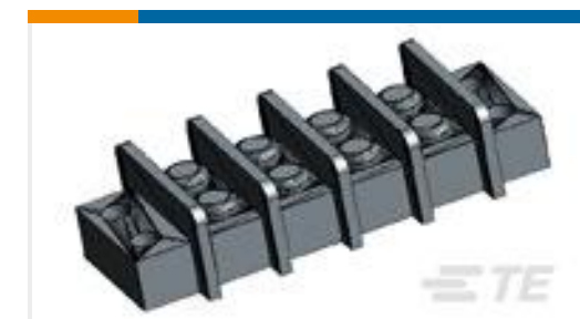
TE 产品编号1546670-4 4P .437" DR BARRIER,W/BND SCRW