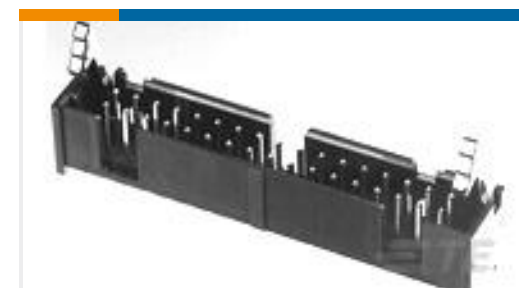
TE 产品编号2-1761606-8 IDC LOW PRO HDR 24P VERT LG LA