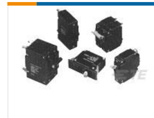
TE 产品编号8-1393254-1 W92-X112-5=M6/M7/M9/W6/W7