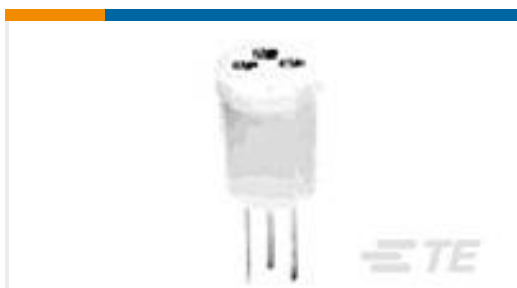
TE 产品编号2-1437508-4 8058-1G49=T05 SKT ASSY 200 CEN