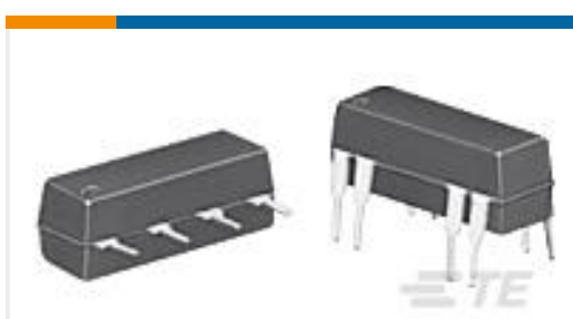
TE 产品编号1393771-5 JWD-107-5=REED RELAYS