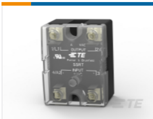
TE 产品编号2-1393030-1 P&B SSRT 系列固态继电器